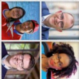
Steffen Kern Präsident des Gnadauer Gemeinschaftsverbands